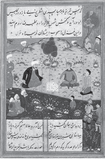
ರುಮಿ ತನ್ನ ಶಿಷ್ಯರೊಂದಿಗೆ

ನಿನಗೆ ಜಾಗವಿಲ್ಲ” ಎಂಬ ನಿಷ್ಕಾರ ಉತ್ತರ ಬರುತ್ತದೆ. ಖಿನ್ನ ಮನಸ್ಸಿನಿಂದ ಈ ವ್ಯಕ್ತಿ ಅಲ್ಲಿಂದ ಹೊರಟು ಇಪ್ಪತ್ತು ವರ್ಷಗಳ ಕಾಲ ಊರೂರು ಸುತ್ತುತ್ತಾನೆ. ಕೊನೆಗೆ ಮತ್ತೆ ಹಿಂದಕ್ಕೆ ಗೆಳೆಯನ ಮನೆಗೆ ಬಂದು ಬಾಗಿಲು ತಟ್ಟುತ್ತಾನೆ. ಪುನಃ ಒಳಗಿನಿಂದ “ಯಾರು ನೀನು?” ಎಂಬ ಪ್ರಶ್ನೆ ಕೇಳಿಸುತ್ತದೆ. ಈತ “ನಾನು ನೀನೇ, ಒಳಗೆ ಬರಬಹುದೇ” ಎಂದಾಗ ಬಾಗಿಲು ತೆರೆಯುತ್ತದೆ. ಒಳಗಿನ ಗೆಳೆಯ “ಈ ಮನೆಯಲ್ಲಿ ಇಬ್ಬರಿಗೆ ಜಾಗವಿಲ್ಲ” ಎಂದು ಹೇಳುತ್ತಾ ಬಂದ ಗೆಳೆಯನನ್ನು ಅಪ್ಪಿ ಸ್ವಾಗತಿಸುತ್ತಾನೆ.